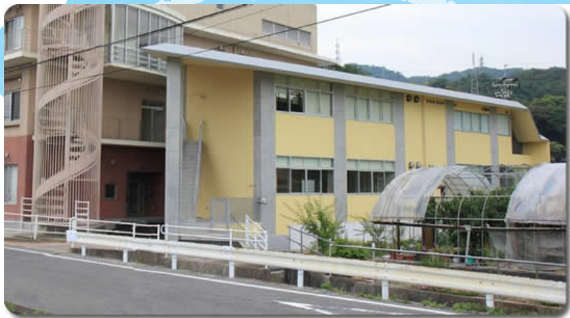
岩国市療育センター